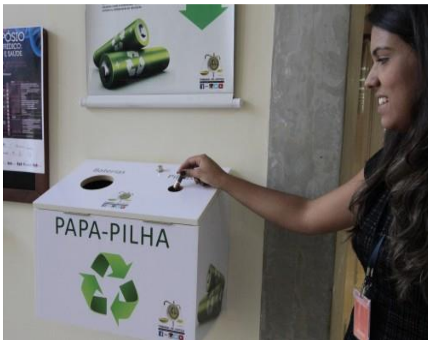
Figura 2 – Projeto papa pilha.