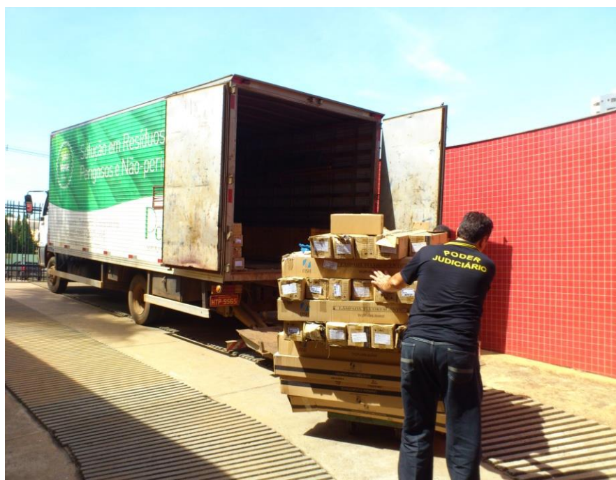
Figura 1 – Coletas das lâmpadas

*Pilhas e baterias referente a coleta 2015.