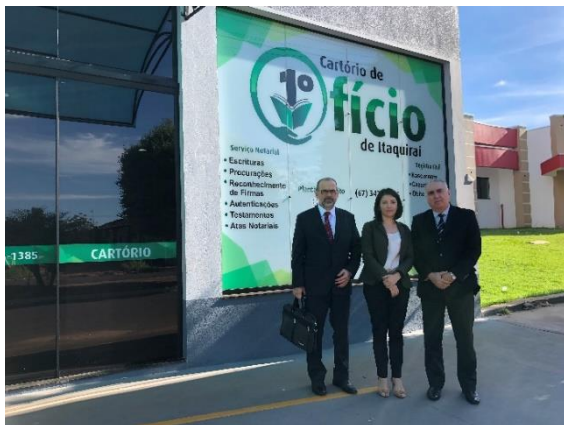
Serviço Notarial e de Registro Civil das Pessoas Naturais e de Interdições e Tutelas