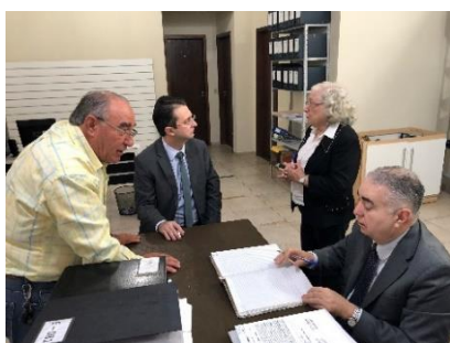
Serviço Notarial e de Registro Civil das Pessoas Naturais e de Interdições e Tutelas