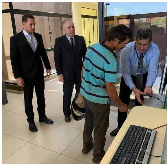
No Fórum, inaugurando o sistema de apresentação da biometria do apenado.