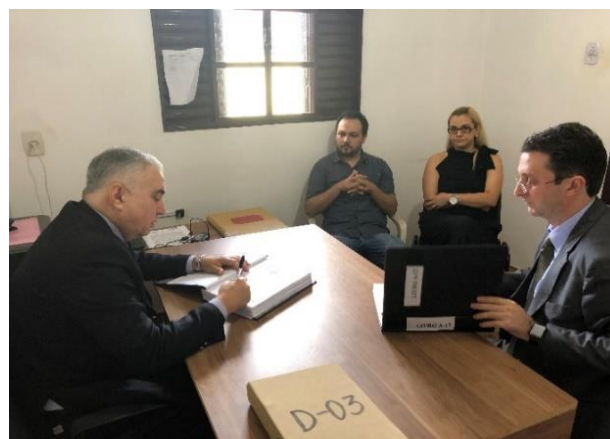
Serviço Notarial e de Registro Civil das Pessoas Naturais do Município de Juti