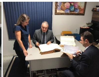
Serviço Notarial e de Registro Civil das Pessoas Naturais do Município de Tacuru