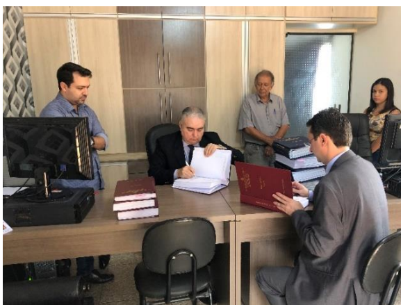
Serviço Notarial e de Registro Civil das Pessoas Naturais do Distrito de Cristalina