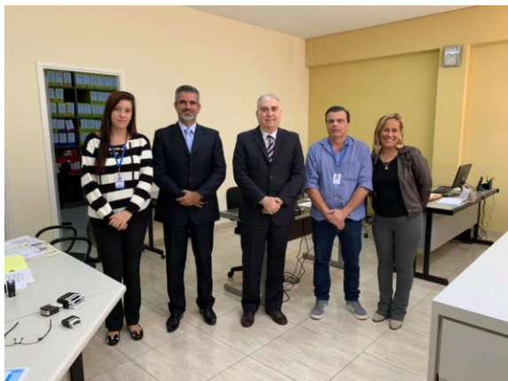
Serviço notarial e de Registro Civil das Pessoas Naturais e de Interdições e tutelas