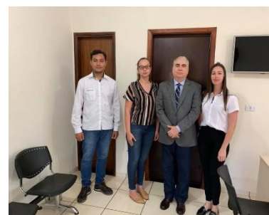
Douradina - Cartório de Notas e de Registro Civil.