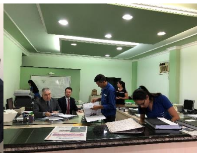
Serviço de Registro de Imóveis, de Títulos e Documentos e Civil das Pessoas Jurídicas e de Tabelionato de Protesto de Títulos