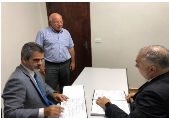
Serviço de Registro de Imóveis, de Títulos e Documentos e Civil das Pessoas Jurídicas e de Tabelionato de Protesto de Títulos