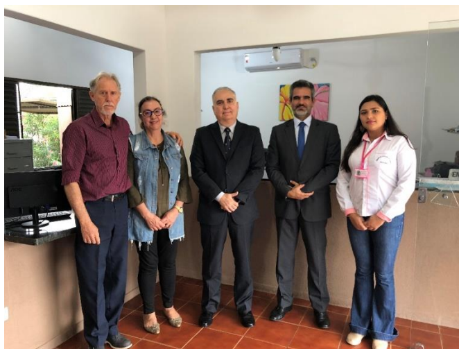
Serviço Notarial e de Registro Civil das Pessoas Naturais do Município de Figueirão