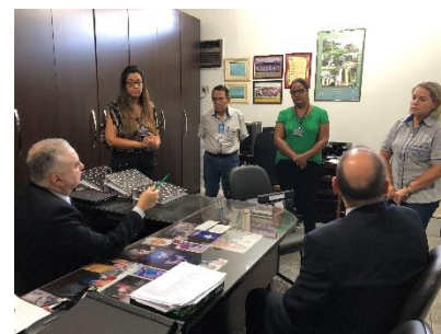
1º Serviço Notarial e de Tabelionato de Protesto de Títulos