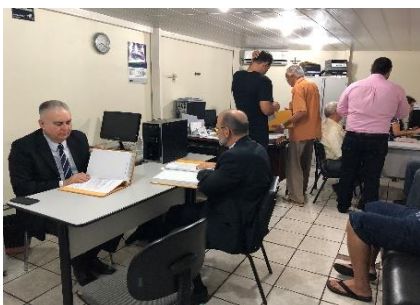
2º Serviço Notarial e de Registro Civil das Pessoas Naturais e de Interdições e Tutelas