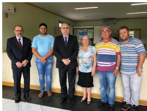
Serviço Notarial e de Registro Civil das Pessoas Naturais e de Interdições e Tutelas