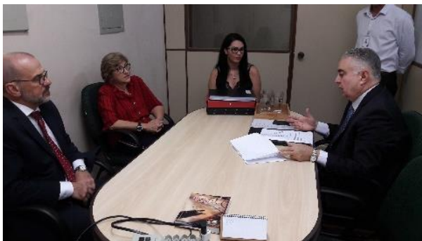
1º Serviço Notarial e de Registro de Imóveis, de Títulos e Documentos e Civil das Pessoas Jurídicas