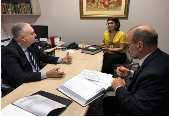
Serviço de Registro de Imóveis, de Títulos e Documentos e Civil das Pessoas Jurídicas e de Tabelionato de Protesto de Títulos