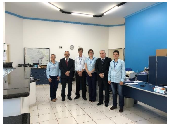
Serviço de Registro de Imóveis, de Títulos e Documentos e Civil Das Pessoas Jurídicas e de Tabelionato de Protesto de Títulos