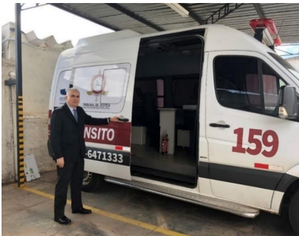
Justiça Itinerante e Comunitária