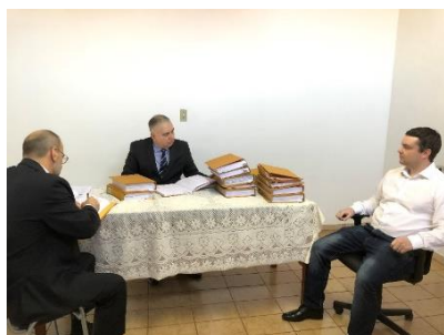
Serviço Notarial e de Registro Civil das Pessoas Naturais e de Interdições e Tutelas