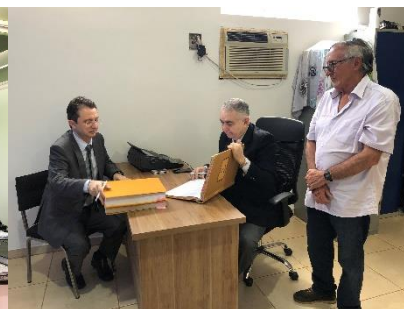
Serviço Notarial e de Registro Civil das Pessoas Naturais do Município de Paranhos