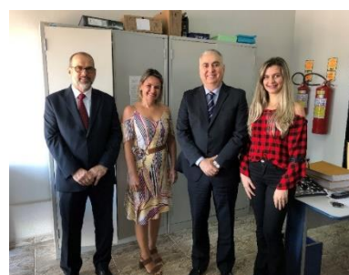
Serviço Notarial e de Registro Civil das Pessoas Naturais do Município de Japorá