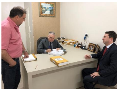
Serviço Notarial e de Registro Civil das Pessoas Naturais e de Interdições e Tutelas