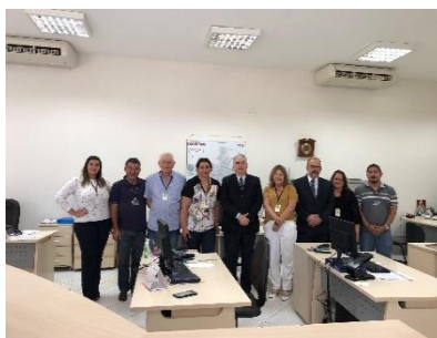
Serviço de Registro de Imóveis, de Títulos e Documentos e Civil das Pessoas Jurídicas