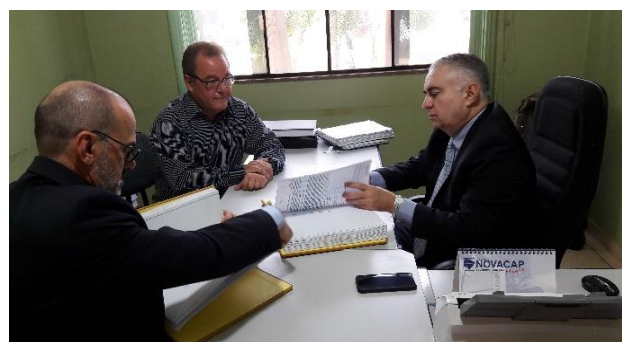
Serviço Notarial e de Registro Civil das Pessoas Naturais e de Interdições e Tutelas