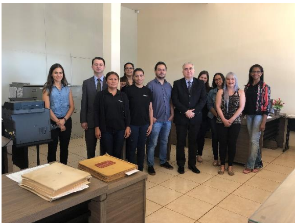
Serviço Notarial e de Registro Civil das Pessoas Naturais e de Interdições e Tutelas