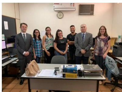
Itaporã - Cartório de Registro de Imóveis