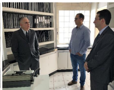
Serviço de Registro de Imóveis, de Títulos e Documentos e Civil das Pessoas Jurídicas e de Tabelionato de Protesto de Títulos