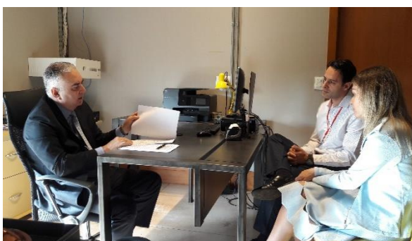
Serviço de Registro de Imóveis, de Títulos e Documentos e Civil das Pessoas Jurídicas e de Tabelionato de Protesto de Títulos