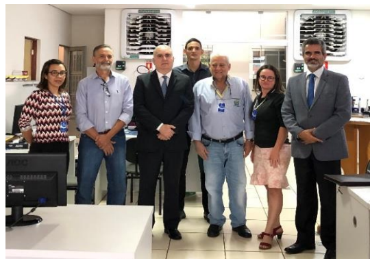
Serviço Notarial e de Registro Civil das Pessoas Naturais e de Interdições e Tutelas