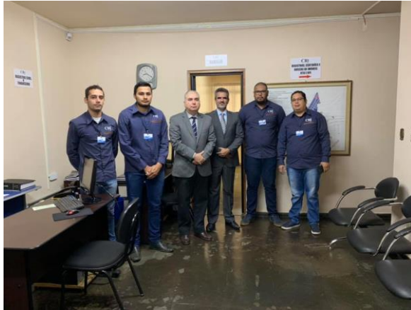
Anastácio – Cartório de Registro de Imóveis