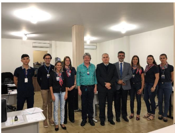
Serviço de Registro de Imóveis, de Títulos e Documentos, Civil das Pessoas Jurídicas e Civil das Pessoas Naturais e de Interdições e Tutelas