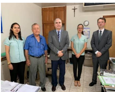
Itaporã - Tabelionato e Registro Civil