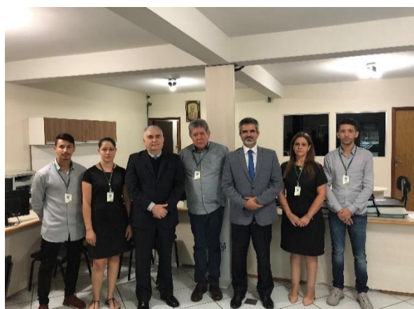
Serviço Notarial e de Tabelionato de Protesto de Títulos