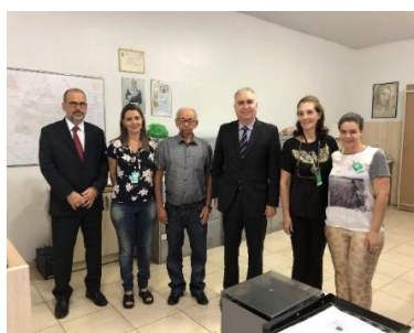
Serviço de Registro de Imóveis, de Títulos e Documentos e Civil das Pessoas Jurídicas e de Tabelionato de Protesto de Títulos