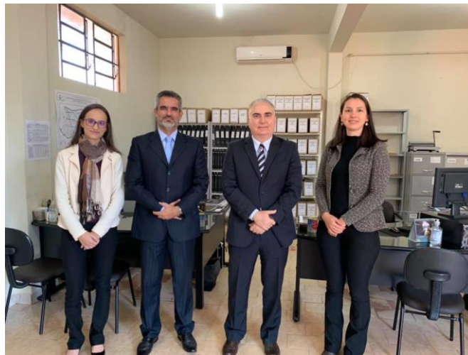
Serviço Notarial e de Registro Civil das Pessoas Naturais do Município de Novo Horizonte do Sul