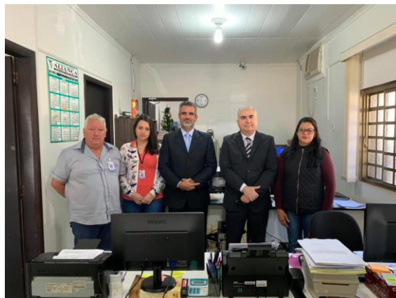
Serviço de Registro de Imóveis, de Títulos e Documentos e Civil das Pessoas Jurídicas e de Tabelionato de Protesto de Títulos