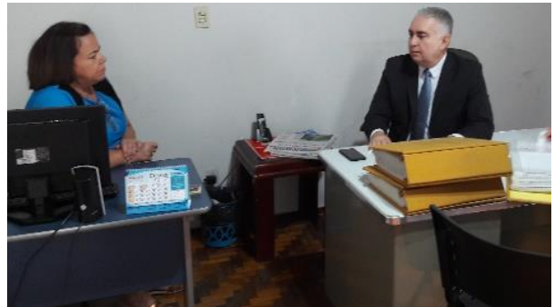
2º Serviço Notarial e de Registro Civil das Pessoas Naturais e de Interdições e Tutelas