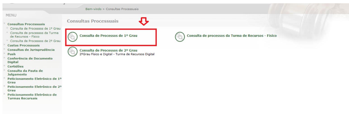
Imagem 3: Consulta de Processos de 1º Grau

Nessa tela, selecione a COMARCA, escolha uma das opções no campo PESQUISAR POR, preencha a pesquisa conforme a opção selecionada e informe o CÓDIGO DE SEGURANÇA. Caso o processo seja um sequencial (0800015-82.2013.8.12.0999/0001 por exemplo), a consulta deverá ser realizada através do processo principal e após realizada a consulta, clicar em Incidentes, ações incidentais, recursos e execuções de sentenças.